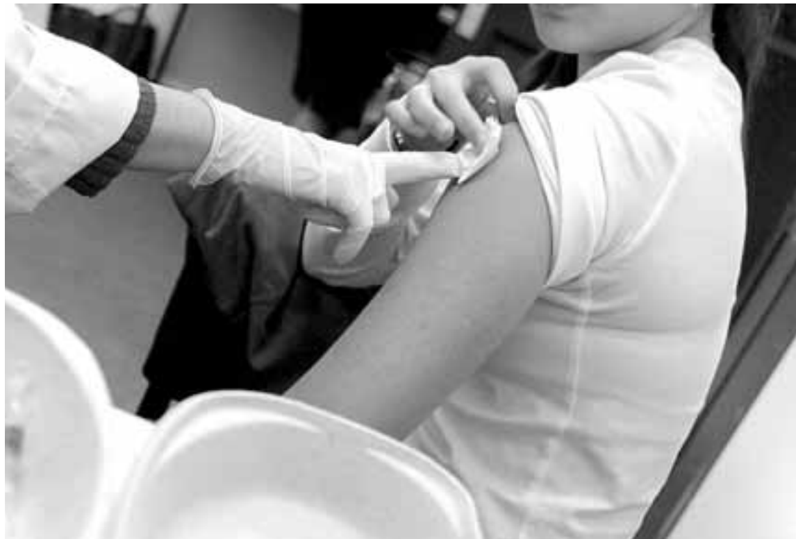
Un niño recibe una vacuna.

La mayoría de los casos se han registrados en la primera quincena de junio. En concreto, hasta acabar mayo únicamente se habían detectado 14 afectados mientras que en junio se han declarado otros 28 casos. Con todo, la semana pasada (12-18 de junio) la incidencia descendió y se declaró solamente un caso. Esta circunstancia podría significar que el brote comienza a remitir aun-